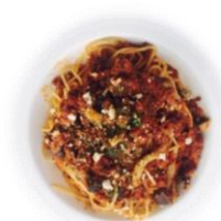
E. 自家製ボロネーゼ