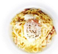
C. 半熟卵のカルボナーラ