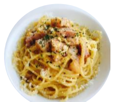
F. とろ玉ペペロンチーノ