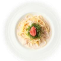
B. 博多明太子のクリームパスタ