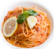
A. モッツアレラチーズの トマトパスタ