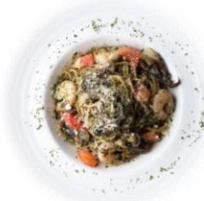
D. 海老とイカのバジルパスタ